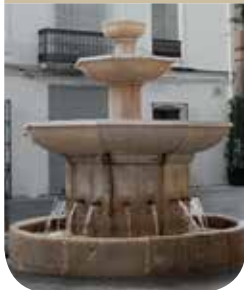
Font de Setze Xorros