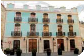
Casa de Cultura